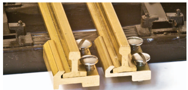
Vergleich der beiden Schienenverbinder in der Frontalansicht Comparison of the two rail connectors in front view

The Rail Clamps will be provided with high quality stainless steel slotted screws, just as before. The slots being very practi-