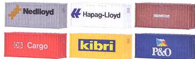
N 37740 ★ 20-Fuß High Cube Container, 6 Stück – Bausatz High Cube Binnencontainer Htt 6/251. Solche Container werden als kompakte Transportmittel auf der Straße, Schiene oder auf dem Wasser verwendet. L 3,8 x B 1,5 x H 1,8 cm 20 ft high cube container, 6 pieces – Kit Inland high cube container Htt 6/251. More and more containers are used for consolidated transports on streets, tracks and water. L 3.8 x W 1.5 x H 1.8 cm