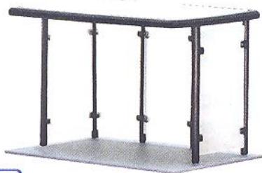
N 37125 ★ Bushaltestelle mit Flachdach – Bausatz L 2,8 x B 1,5 x H 1,7 cm Bus stop with flat roof – Kit L 2.8 x W 1.5 x H 1.7 cm