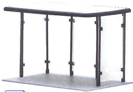
HO 38179 ★ Bushaltestelle mit Flachdach – Bausatz L 5,1 x B 2,8 x H 3,1 cm Bus stop with flat roof – Kit L 5.1 x W 2.8 x H 3.1 cm